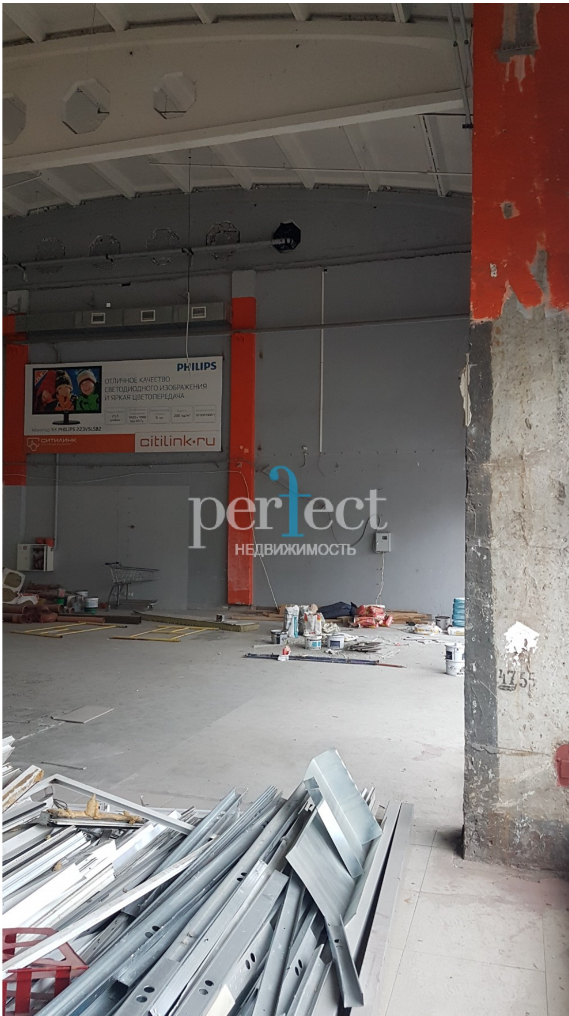
8 (495) 699-48-44 127051, г. Москва, 2-ой Колобовский пер., 9/2 стр.1, офис 9