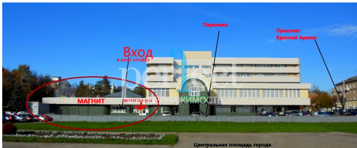
Центральная площадь города

Парковка на 40 м/мест. Якорные арендаторы: Магнит, Ситилинк, Смешные цены. Окружение: Администрация города, Жилой сектор, Офисный центр, отель, МФЦ, парк культуры и отдыха. Отдельный вход с улицы. Зальная планировка, Витрина. Высота потолков 3,5 метра. Можно взять часть помещения. Возможное применение: торговая площадь, салон красоты, представительство, интернет магазин, пункт выдачи, интернет доставка, шоурум, магазин, консалтинговая компания, кондитерская, кофейня, кафе и другие ваши варианты.